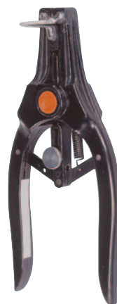
Расширитель KN с 3 наконечниками