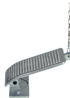
Педаля управления серии H

* инструмент поставляется без наконечников (заказывать отдельно)