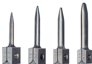
Наконечники серии H