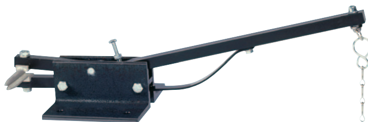
Инструмент серии H